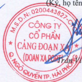
Trần Việt Hùng