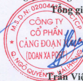
Trần Việt Hùng